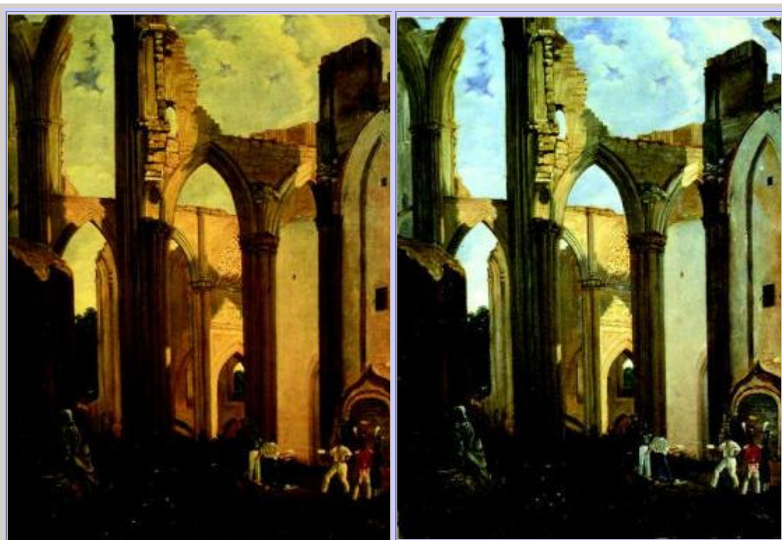
Duellscene vor Kirchenruine (Wilhelm Meyer)

Ein idealer Harz-Rohstoff sollte nicht nur haltbar sein, sondern auch eine nicht zu grosse molekulare Masse aufweisen, da sonst beim Eintrocknen unebene Oberflächen entstehen. Zudem nimmt die Löslichkeit hochmolekularer Materialien bei der Alterung durch Vernetzung der Moleküle rasch ab. Kann der vergilbte Firnis aber nicht mehr entfernt werden, ist das Gemälde geschädigt. Der Firnis sollte elastisch genug sein, um Spannungen im Gemälde auszugleichen, ohne zu reissen. Starke Oxidationen müssen vermieden werden, da sonst zusammen mit Wasserdampf trübe Stellen entstehen können. Naturstoff-Firnis sollte ausserdem einen Lichtbrechungsindex aufweisen, welcher nahe an demjenigen des Bindemittels der Malschicht liegt, um Lichtstreuungen zu begrenzen, die das Gemälde trübe erscheinen lassen.